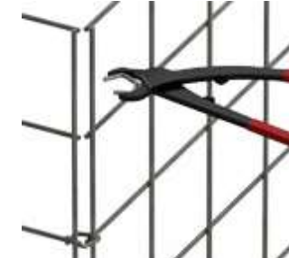
dezenete Optik Spezialzange notwendig Preis für Zange 50,42€

Folgende Optionen sind gegen Mehrpreis ebenfalls möglich: