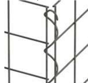
einfaches eindrehen per Hand