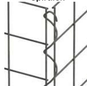
einfaches eindrehen per Hand