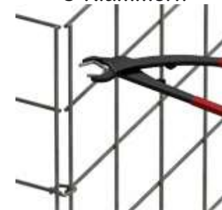
dezente Optik Spezialzange notwendig Preis für Zange 50,42€

Folgende Optionen sind gegen Mehrpreis ebenfalls möglich: