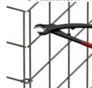
dezente Optik Spezialzange notwendig Preis für Zange 50,42€

Folgende Optionen sind gegen Mehrpreis ebenfalls möglich: